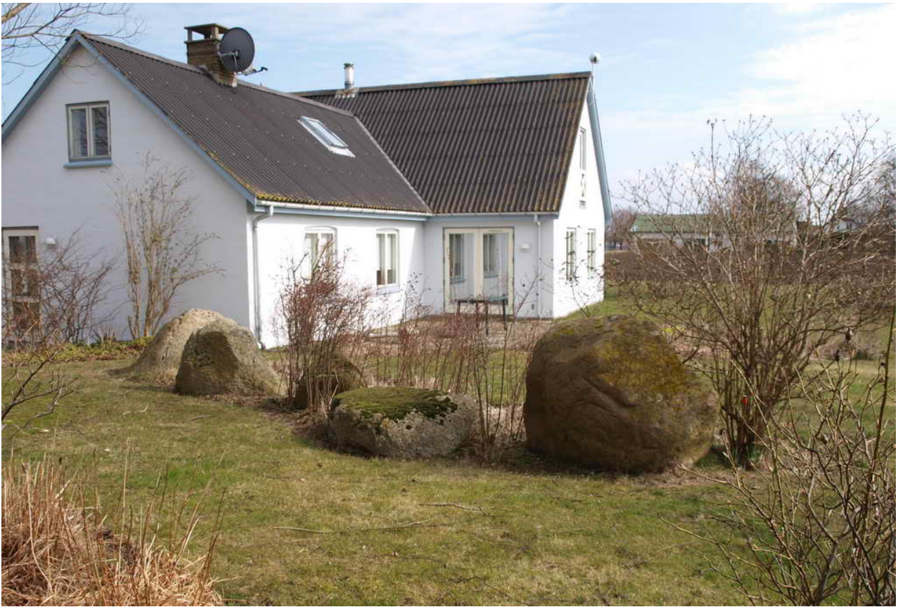
Resterne af Flægedyssen i haven. I baggrunden skimtes Elmegård.